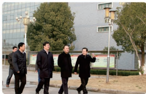
(图/文:王刘宾、组织人事处)

管部长和王部长对我院几年来的快速发展,特别是以优异成绩通过省级示范验收和人才培养个性评估给予充分肯定,对我院领导班子和干部队伍表示高度重视和关心,勉励我院按照十八届三中、四中全会和习总书记系列重要讲话精神以及省市的要求,坚持依法治校、质量立校、特色兴校、人才强校、开放活校,进一步加大改革创新力度,进一步提升社会服务能力,努力建设地方技能型高水平大学。